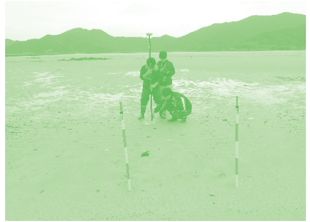
写真1: 砂浜や干潟の微地形の計測(長崎県五島市三井集)。

また、希少生物カプトガニの産卵地の砂浜の再生のため、伊都キャンパスの近隣の瑞梅寺川と今津干潟において、多様なセクターによるボトムアップの土砂や生態系管理を検討している。地域、国内、国際をつなぐ展開として、九州での水フォーラムや、国内での海の生物多様性や市民のネットワークの形成も行っている。これらは環境省環境研究推進費S-13、国土交通省九州地方整備局のご支援にも支えて頂いている。