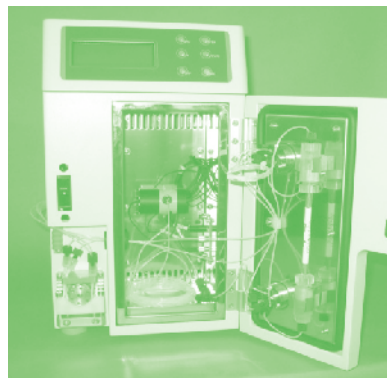
硝酸・亜硝酸フロー分析装置

どをもたらすもので、「グリーン分析法」の到来といえる。写真は環境水中の富栄養化の要因とされている硝酸・亜硝酸を迅速に測定するために開発されたフロー分析装置である。1検体の測定に必要な試料は100 \mu L以下で、1時間に約100検体もの測定が可能であり、廃液量も回分測定法に比べて極めて微量である。この方法では、連続モニタリングも可能であり、実際メンテナンスフリーで1年間も稼働している分析現場も報告されている。