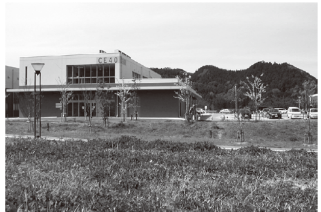
附属循環センター（伊都キャンパス、CE40）

最後になりましたが、附属循環センターではこれから環境問題の解決を目指し循環型社会の構築を支援する研究活動に邁進する所存であります。皆様方におかれましては当センターの研究活動に対する一層のご支援を賜りたくお願いする次第です。よろしくお願ひ申し上げます。