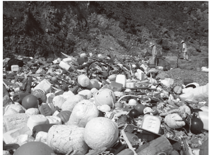
長崎県奈留島ノコビ崎海岸に漂着した漂着ゴミ

問題解決には、各国の各地域が循環型社会に転じ、生態系保全が進んで自然資源も持続的に利用できる状況を形成していく必要があります。