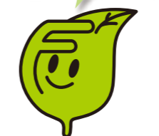
福岡市の環境シンボルキャラクター エコッパ

私たちはレジ袋削減を 実践して出場資格を 得ました! 演目の中にも環境メッセージを入れる工夫をしています。 みなさん見に来てください!